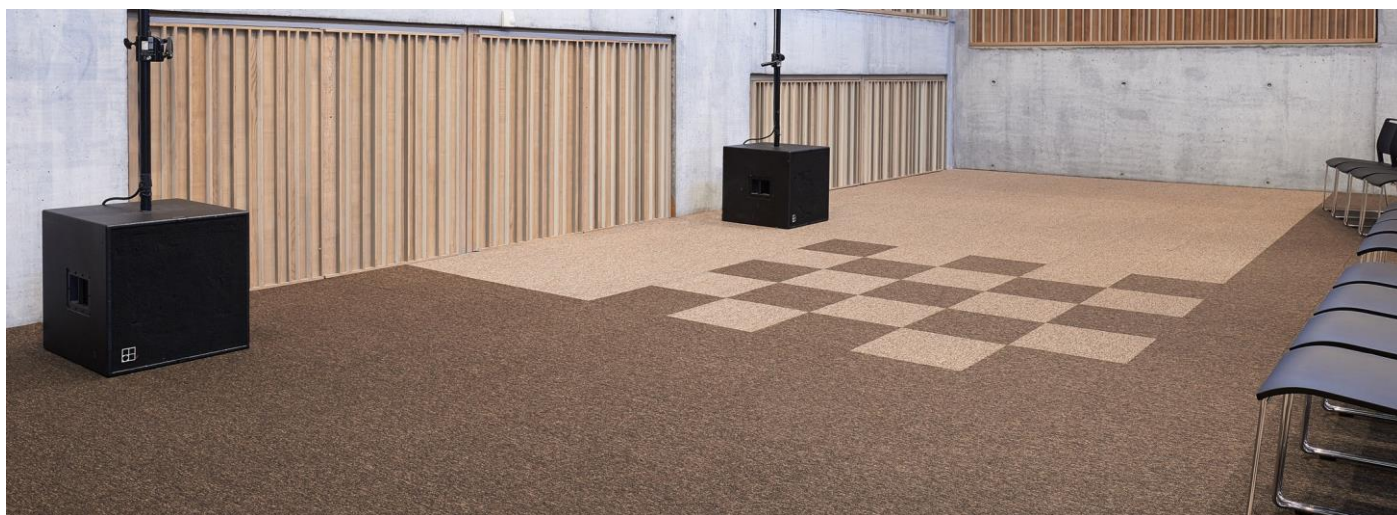
JETSET 49531, 49520