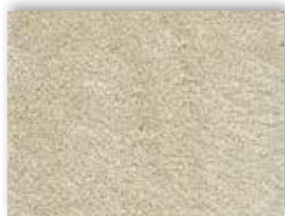
34 4m + 5m