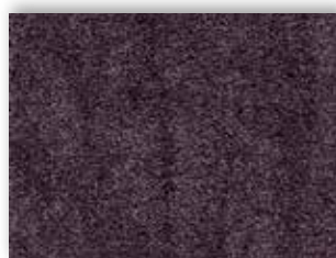
17 4m + 5m