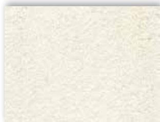
05 4m + 5m