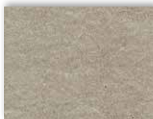
90 4m + 5m