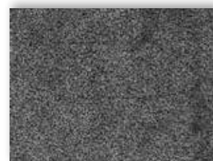
99 4m + 5m