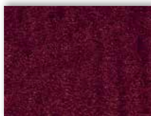
10 4m + 5m