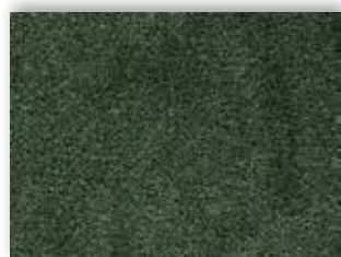
24 4m + 5m