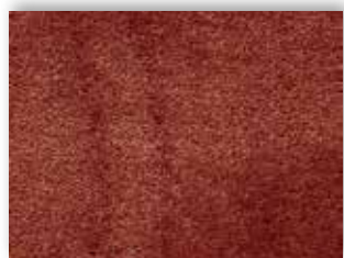
84 4m + 5m