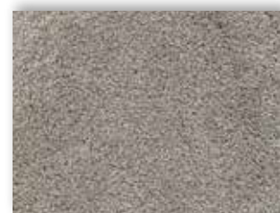
49 4m + 5m