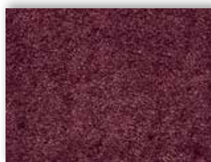
19 4m + 5m