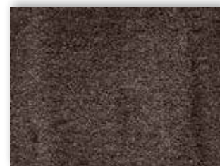
44 4m + 5m