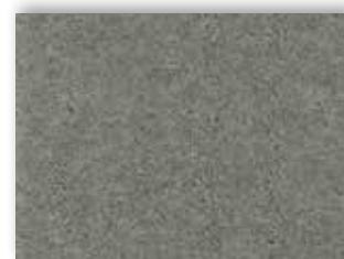
95 4m + 5m