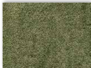
21 4m + 5m