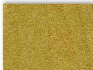
54 4m + 5m