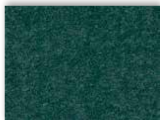
73 4m + 5m