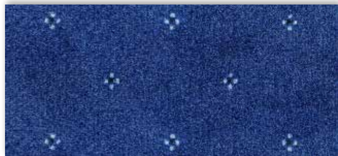
77 4m + 5m

La société Associated Weavers se réserve le droit de modifier les caractéristiques de ce produit tout en conservant les mêmes qualités techniques. Il est fortement conseillé d'utiliser les coloris moyens et foncés pour les pièces à grand trafic.