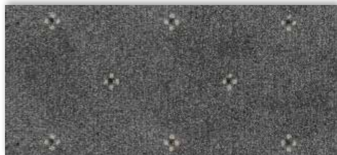
97 4m + 5m