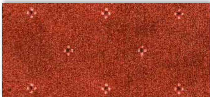
88 4m + 5m