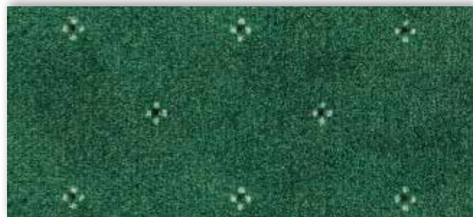
22 4m + 5m