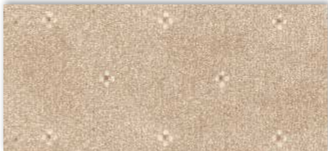
34 4m + 5m