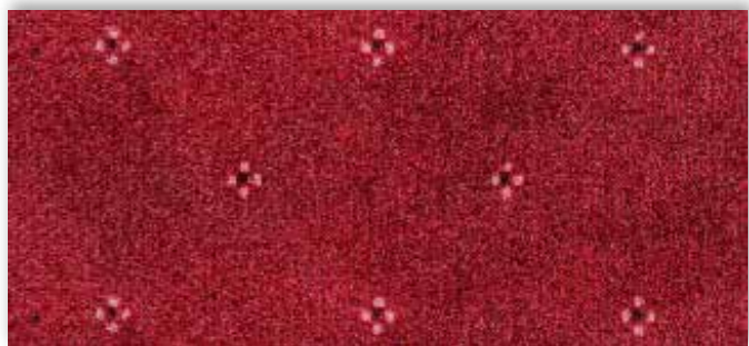
11 4m + 5m