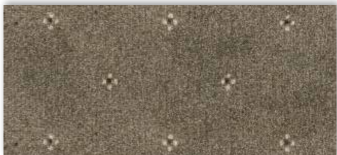
49 4m + 5m