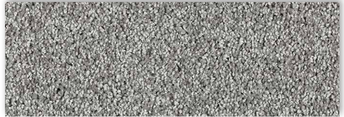
92 4m + 5m