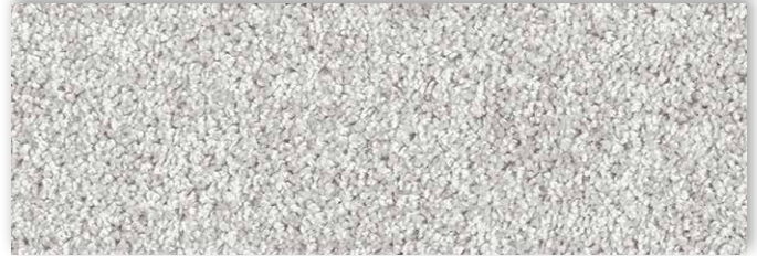
91 4m + 5m