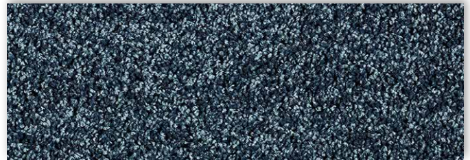
75 4m + 5m