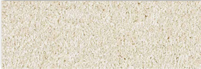
30 4m + 5m