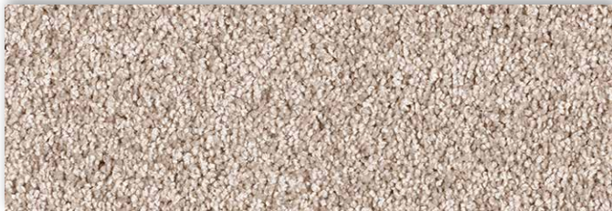
34 4m + 5m