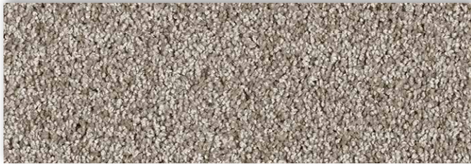
49 4m + 5m