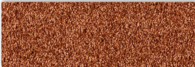
82 4m + 5m