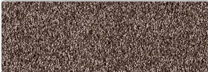
40 4m + 5m