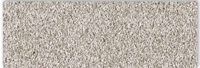
36 4m + 5m