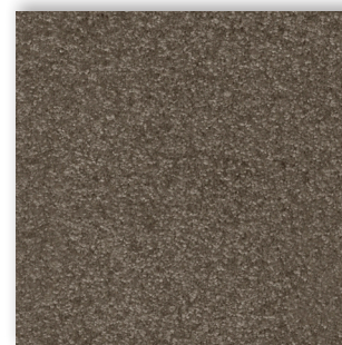
42 4m + 5m