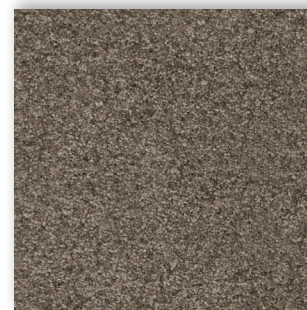
97 4m + 5m