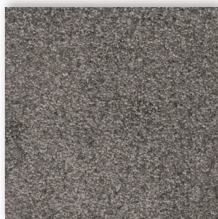
98 4m + 5m