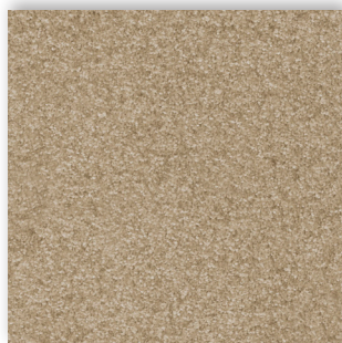
39 4m + 5m