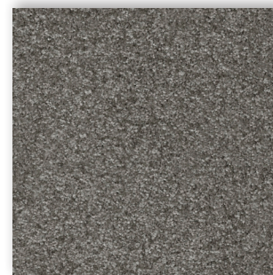
95 4m + 5m