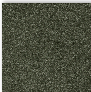
24 4m + 5m