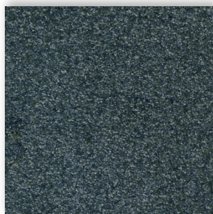
77 4m + 5m