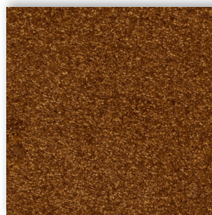
80 4m + 5m