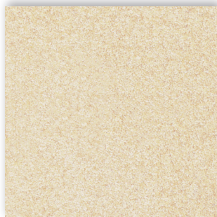
02 4m + 5m