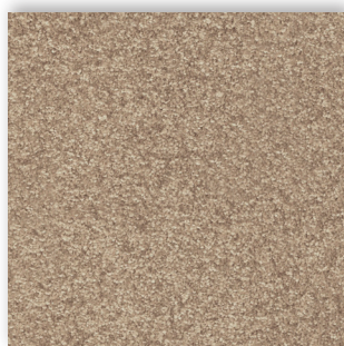
35 4m + 5m