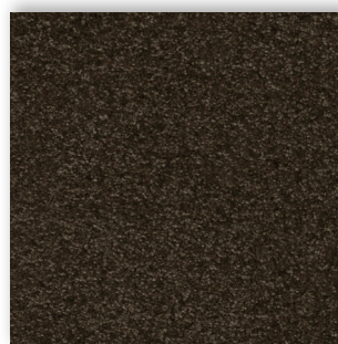
44 4m + 5m