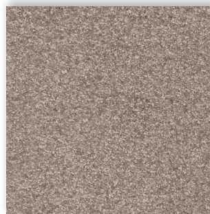
49 4m + 5m