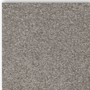
92 4m + 5m